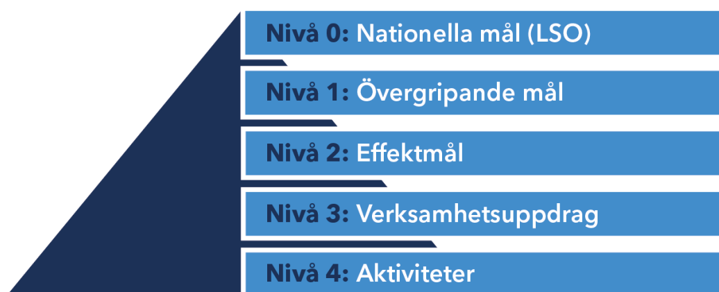
Figur 1. Översikt av den hierarkiska målstrukturen för SSBF:s verksamhet och styrning av LSO.

I verksamhetsplanen anges de verksamhetsuppdrag som SSBF ska arbeta med under året för att uppfylla målen. Verksamhetsuppdragen konkretiseras ytterligare som aktiviteter i SSBF:s aktivitetsplan. Samtliga nivåer visualiseras i Figur 1.